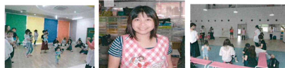
(2歳児の合同で参加の様子です。)